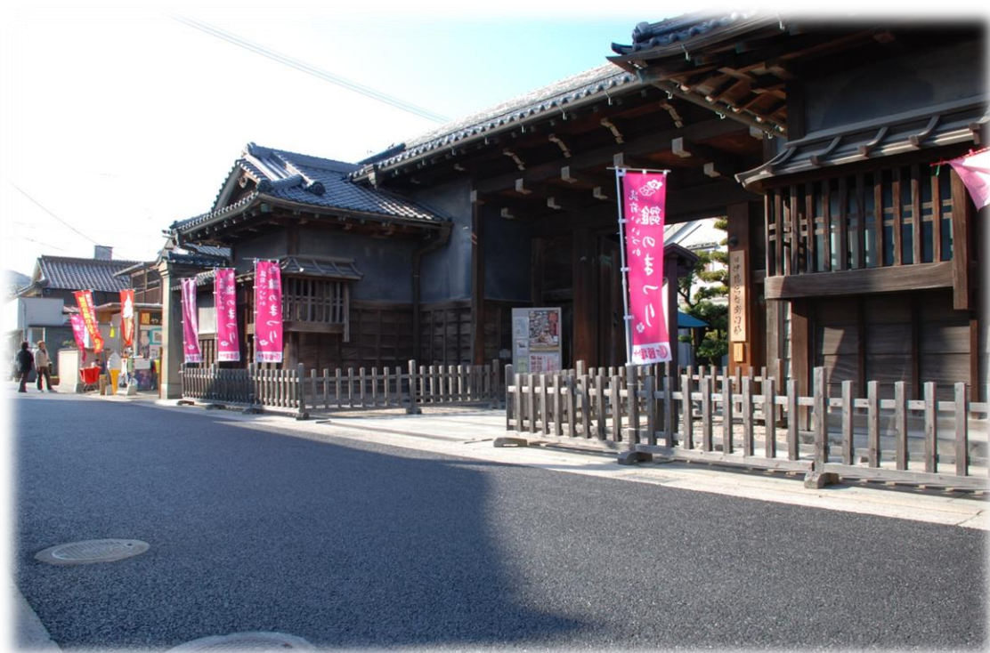
福岡県飯塚市幸袋 旧伊藤伝右衛門邸